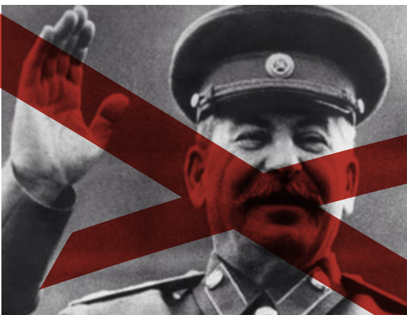
Josef Stalin. Aðalskrivari í kommunistaflokkinum í Sovjetsamveldinum 1922-1953.

Ja tað passar í ávísan mun. Vit fáa fleiri vørur, tøkni og hugskot uttanífrá, frá flogførum til Google til Nelson Mandela. Men Norðurlond geva eisini sítt íkast við grønnari orku, Bang & Olufsen, Lego, fiski, Björk, Linux, Skype og Spotify!