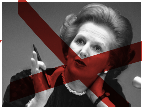
Margaret Thatcher. Forsætisráðharri í Stórabretlandi 1979-1990.